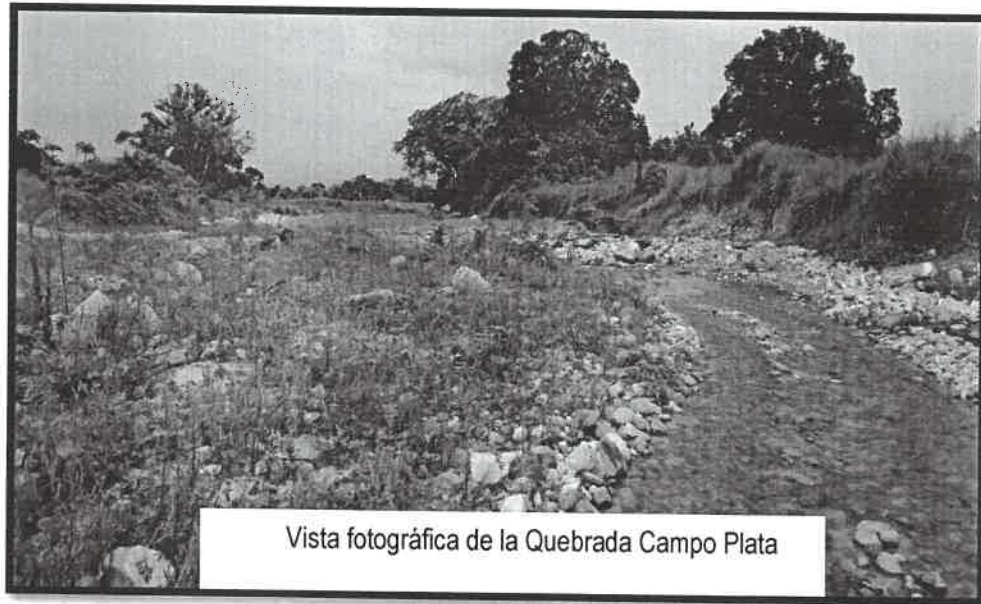
Vista fotográfica de la Quebrada Campo Plata

subsuelo del cauce y alrededores, metas físicas del Perfil Técnico del Proyecto, clasificación del material de desplante y el Ancho estable del Cauce.