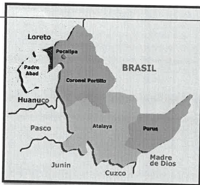
Imagen N°02: Mapa de macro localización del Departamento de Ucayali