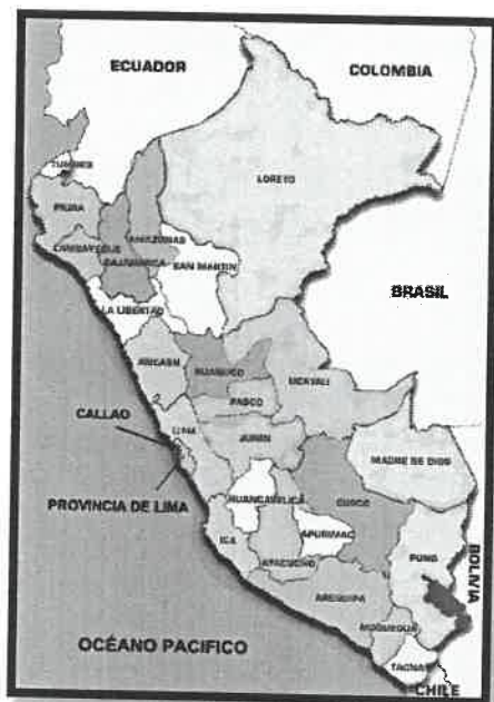
Imagen N°01: Mapa de macro localización del Perú