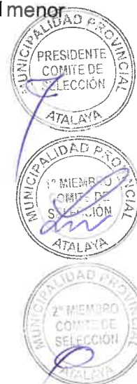
Cuadro N° 04:

El Distrito de Raymondi tiene un área de 14 508.51 km 2 , cuya densidad poblacional es de 1.72 hab./km 2 , condición que se explica por su función urbana y de principal centro de servicios de la provincia.