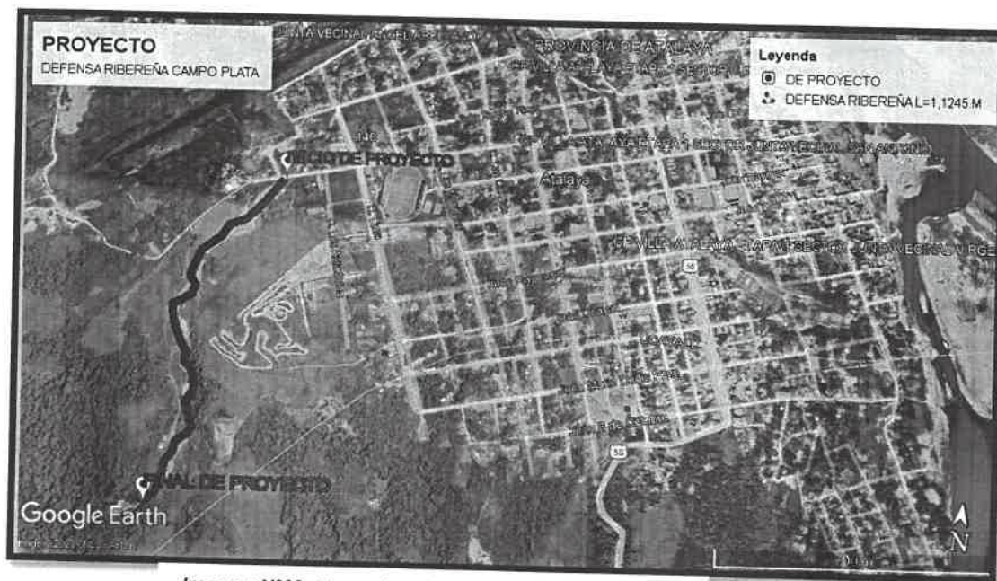
Imagen N°03: Mapa de micro localización del terreno para el proyecto con el Centro de la Ciudad.