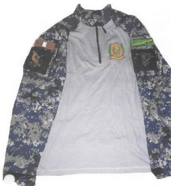
POLO DE TELA DRY MODELO TACTICO