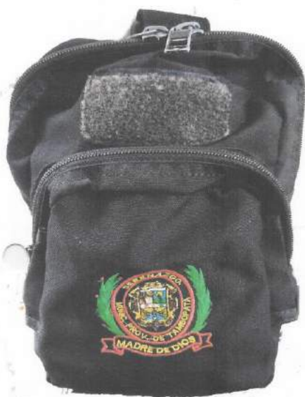
CANGURO O MUSLERA TACTICA