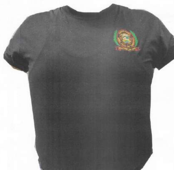
POLO DE TELA DRY MANGA CORTA