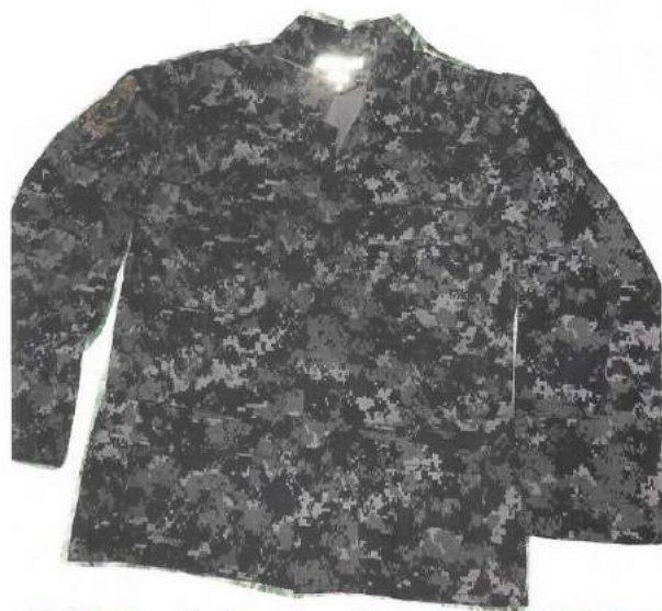
POLO O CAMISA TACTICA