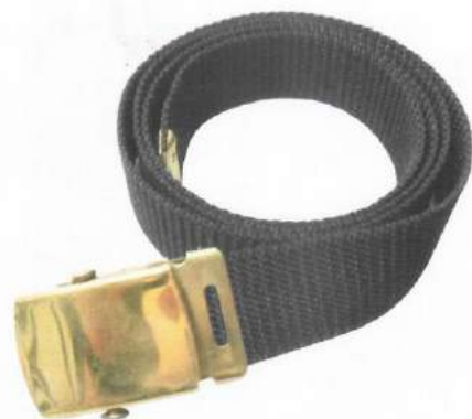
CORREA DE LONA