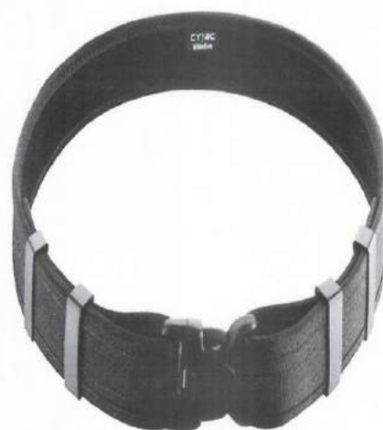
CORREAJE DE LONA