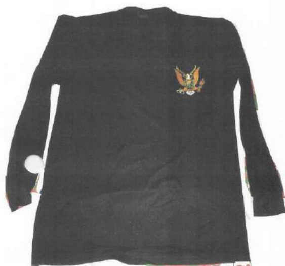
POLO DE TELA DRY MANGA LARGA