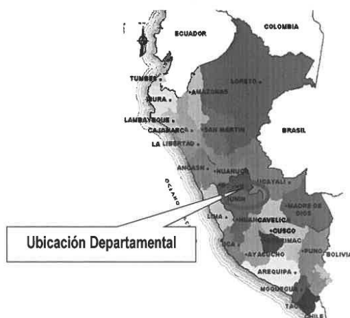
Figura N° 01. Ubicación departamental del proyecto