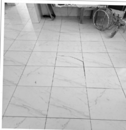
Zócalos y piso en mal estado, requieren sustitución de cerámico