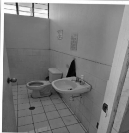
El sistema sanitario requiere mantenimiento