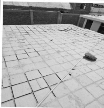
El techo aligerado se encuentra en mal estado por la filtración de la humedad