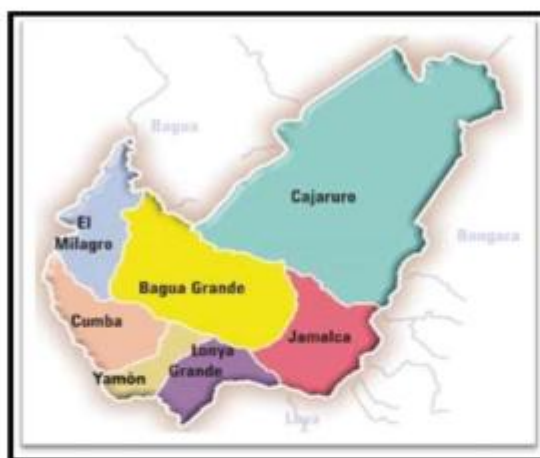
MAPA N°03: MICRO LOCALIZACIÓN DEL PROYECTO