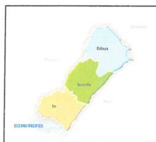
PROVINCIA DE JORGE BASADRE