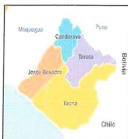
DEPARTAMENTO DE TACNA