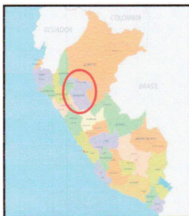
Imagen N°01: Ubicación nacional del proyecto.