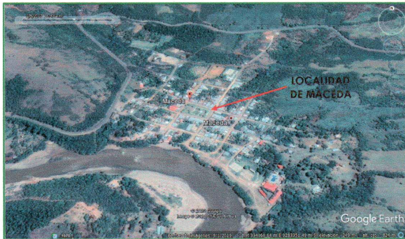
Imagen N°04: Maceda – Rumisapa – Lamas.

SERVICIO DE CONSULTORÍA PARA LA SUPERVISIÓN DE LA EJECUCIÓN DE LA OBRA "CREACIÓN DEL SISTEMA DE DRENAJE PLUVIAL DE LA LOCALIDAD DE MACEDA DEL DISTRITO DE RUMISAPA – PROVINCIA DE LAMAS – DEPARTAMENTO DE SAN MARTÍN"