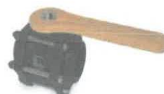
Valvulas full port 2"