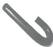
Tubo de aireación 2"