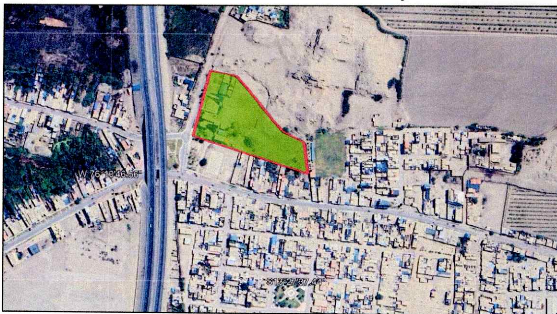
Imagen 2: Vista Satelital del Ámbito de Influencia del Proyecto