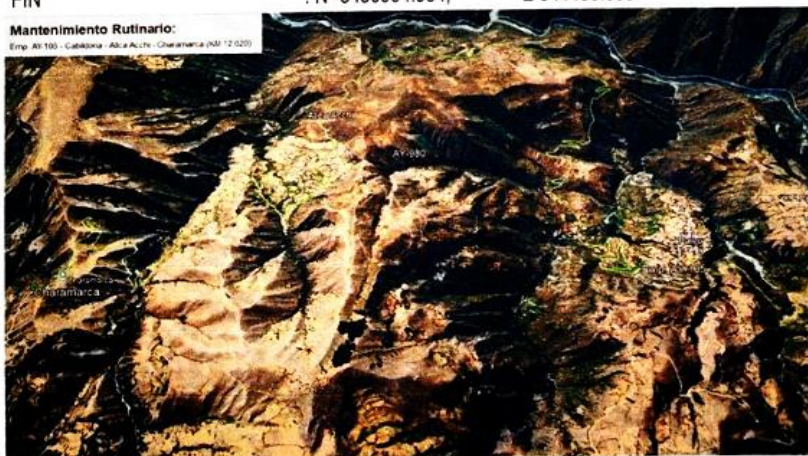
Imagen satelital google heart, de la ubicacion del tramo

Mantenimiento Rutinario: Emp. AY-105 - Cabildona - Allca Acchi - Charamarca (KM 12.620)