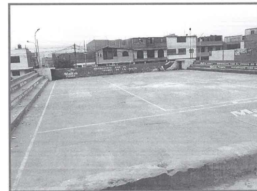
Imagen 03 – Vista actual de la zona a intervenir.