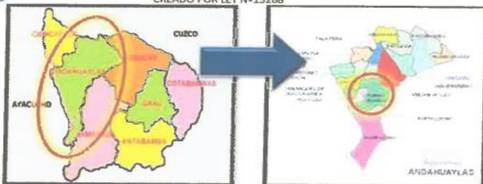
Figura 3: Mapa político del departamento de Apurímac, teniendo como referencia el mapa del Perú.