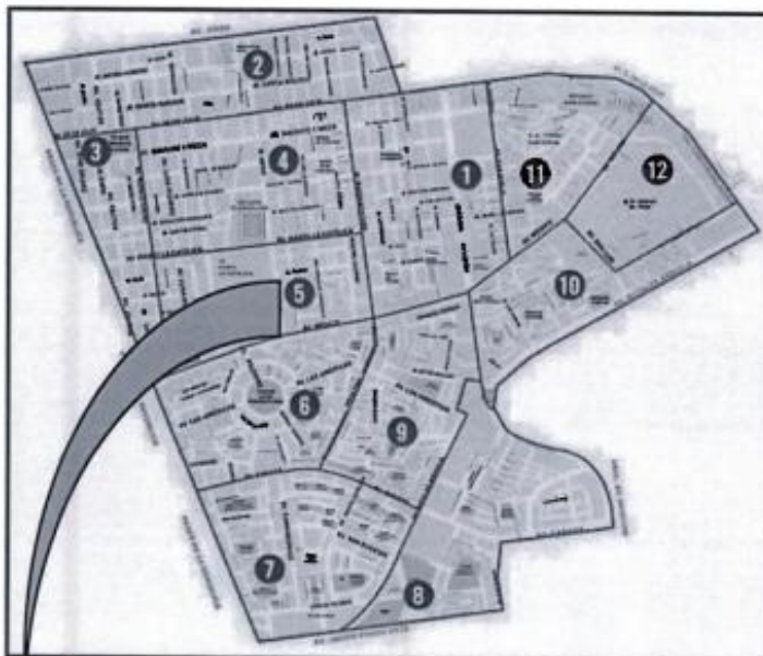
Imagen N°01: Ubicación del proyecto según la zona

“Año de la recuperación y consolidación de la economía peruana”