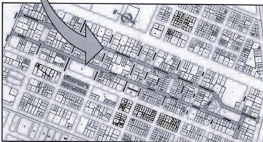
Imagen N°02: Ubicación del Proyecto