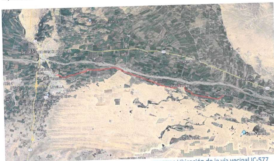
IMAGEN 1 Ubicación de la vía vecinal IC-577

Es así que la Municipalidad Provincial de Pisco priorizó como consecuencia de la demanda de la población, la elaboración de un Proyecto de Inversión en el marco del Sistema Nacional de Programación Multianual y Gestión de Inversiones INVIERTE.PE, que sustente que las intervenciones planteadas dará solución a la problemática existente, con costos efectivos y socialmente rentables, enmarcados en los lineamientos de política del sector que se ajuste con certeza a la necesidad y demanda actual de los pobladores y contribuyendo con el bienestar de la población.