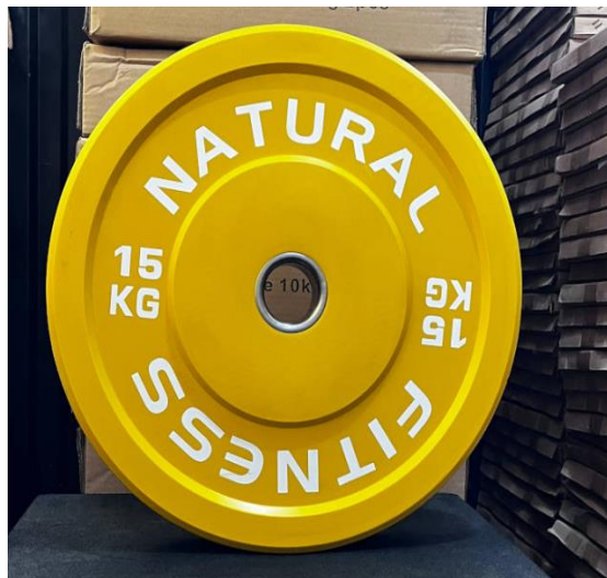
DISCOS DE CAUCHO DE 10KG