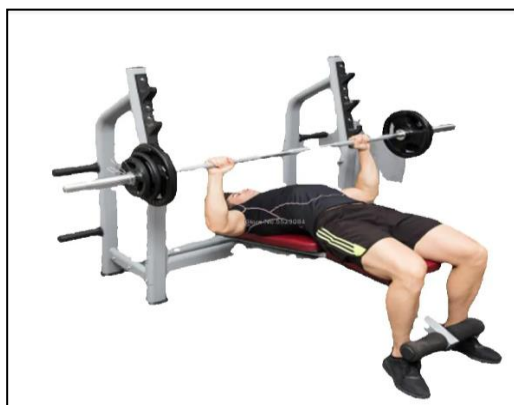
SOPORTE DE BARRA OLIMPICA

Aparato diseñado para realizar press banca de pecho, fabricado a base de una estructura metálica con soportes para colocar la barra