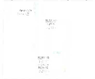
Figura N° 02 Sección de la Viga Diafragma

Los estribos planteados son de concreto armado f'c=280 kg/cm 2 los cuales tendrán la función de transmitir las cargas hacia el terreno además de servir como soporte al empuje lateral causado por el terreno, se construirán dos estribos ubicados en los extremos del puente proyectado con las siguientes dimensiones según los cálculos de diseño realizados que se presentan en la siguiente imagen