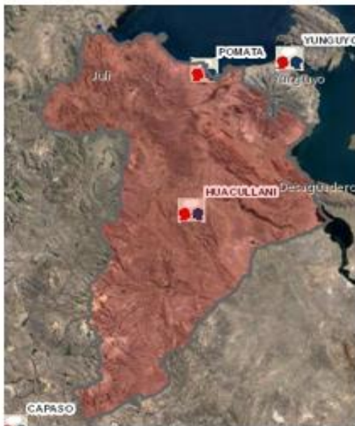
PROVINCIA DE CHUCUITO