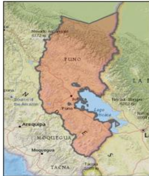
DEPARTAMENTO DE PUNO