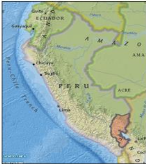
MAPA DEL PERÚ