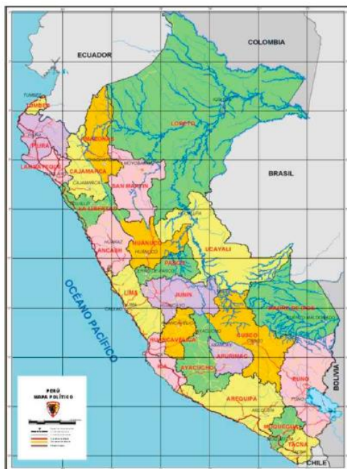
MAPA POLÍTICO DEL PERÚ