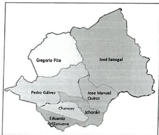
PROVINCIA – SAN MARCOS

"AÑO DEL BICENTENARIO, DE LA CONSOLIDACIÓN DE NUESTRA INDEPENDENCIA, Y DE LA CONMEMORACIÓN DE LAS HEROICAS BATALLAS DE JUNÍN Y AYACUCHO"