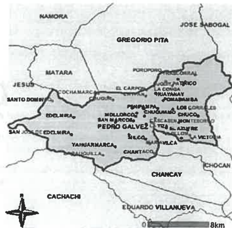
DISTRITO – PEDRO GÁLVEZ