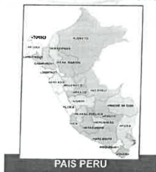
ESQUEMA N°01. UBICACIÓN DE ÁMBITO DEL PROYECTO.