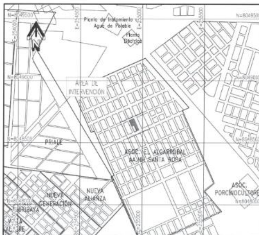
Figura 2. Microlocalización de Terreno a Intervenir

MUNICIPALIDAD DISTRITAL EL ALGARROBAL SUB GERENCIA DE ESTUDIOS Y PROYECTOS