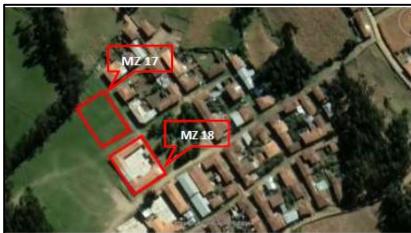
TABLA N° 4. Ubicación por coordenadas