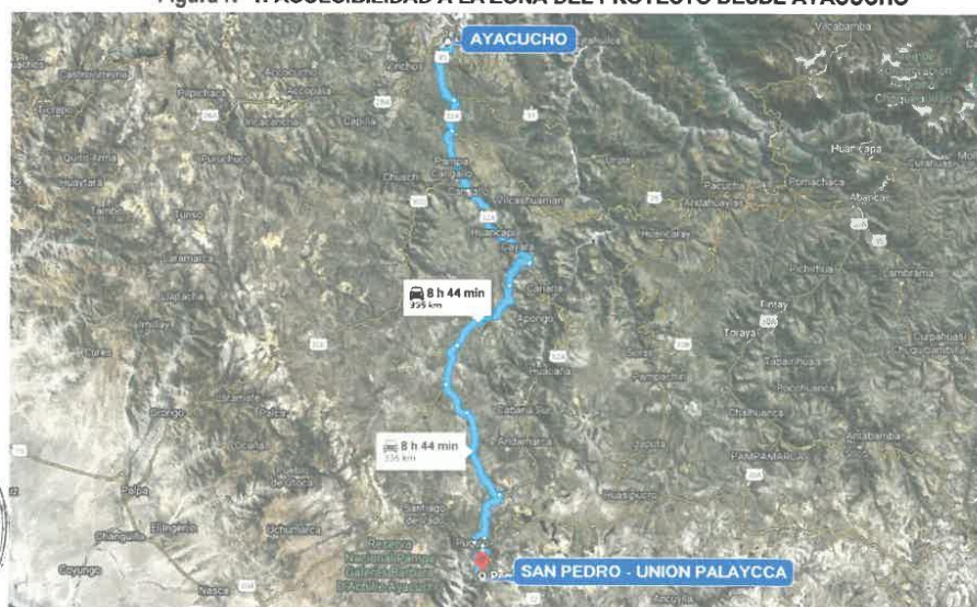
Figura N° 1: ACCESIBILIDAD A LA ZONA DEL PROYECTO DESDE AYACUCHO