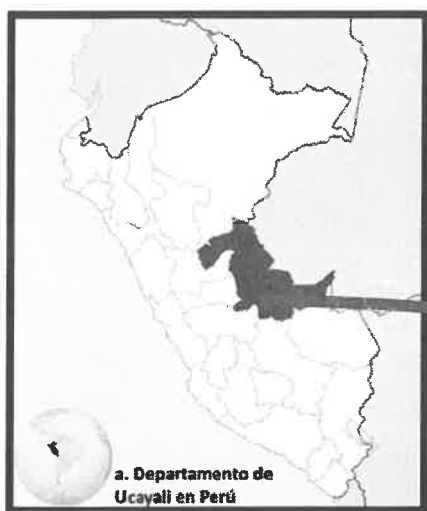
Mapa de macro localización

Altitud : 240 m.s.n.m. Región : Ucayali Provincia : Atalaya Distrito : Raimondi Ciudad : Atalaya