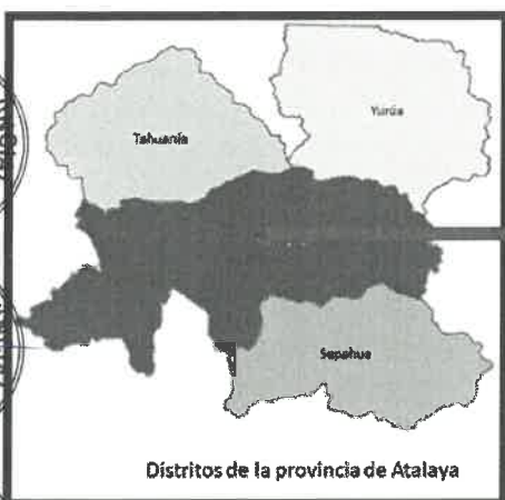
Mapa de la localización de la ciudad de Atalaya