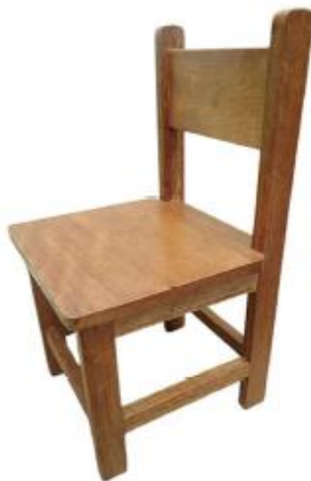
Imagen referencial N° 03.- Silla y mesa

"Wasi del Pensamiento, de la construcción de nuestra Identidad, y de la construcción de las buenas Escuelas del Perú y el mundo"