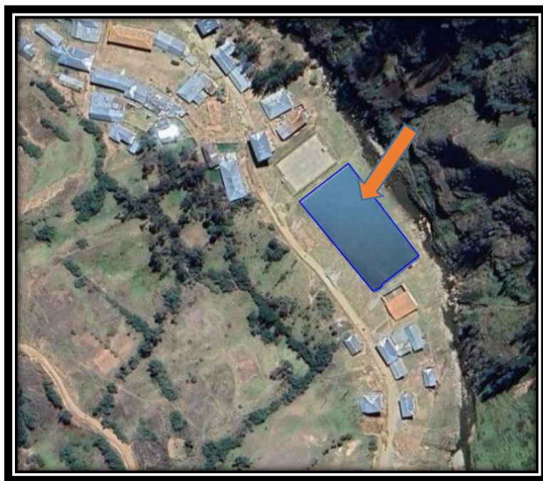
Ilustración 3: Terreno nuevo donde se va a construir la Institución Educativa de Vaquería

UBICACIÓN : La Obra se Encuentra Localizada en: