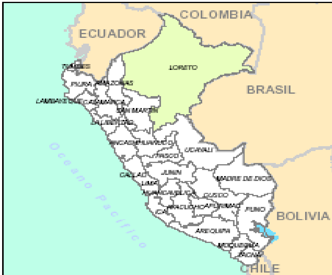
Mapa 01: Mapa de ubicación de la Región Loreto dentro del Mapa político del Perú.