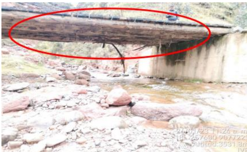
Figura 4. Vista Frontal

Se observa que el puente no cuenta con barandas de seguridad, lo que es un riesgo latente. El puente no cuenta con accesos ni lozas de aproximación, no cumple con los estándares del manual de puentes.