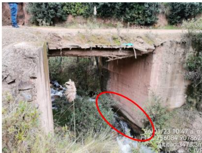
Figura 3. Estribo Izquierdo

Se observa que el puente no cuenta con barandas de seguridad, lo que es un riesgo latente. El puente no cuenta con accesos ni lozas de aproximación, no cumple con los estándares del manual de puentes.