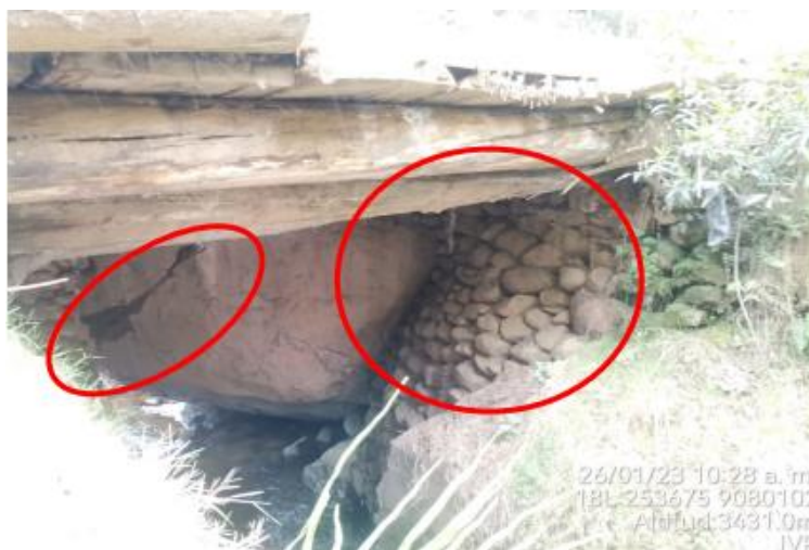
Figura 2. Vista Frontal