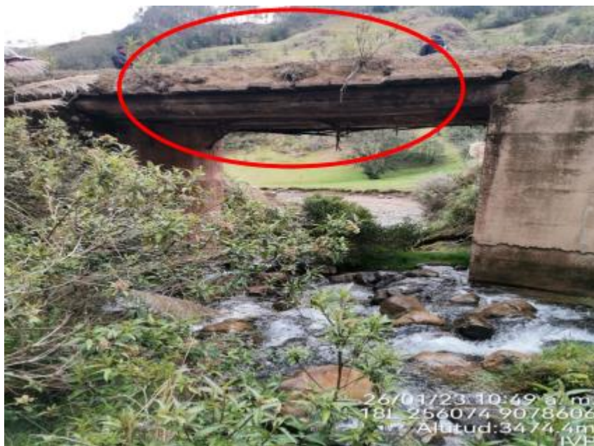
Figura 4. Vista Frontal

Se observa que el puente no cuenta con barandas de seguridad, lo que es un riesgo latente. El puente no cuenta con accesos ni lozas de aproximación, no cumple con los estándares del manual de puentes.