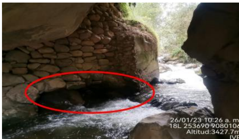
Figura 3. Vista Frontal

Se observa que el estribo izquierdo presenta socavación por contracción o acorazamiento de su cauce. No cumple con los estándares del manual de puentes.