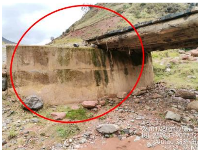
Figura 3. Vista Estribo Izquierdo

Se observa que el estribo izquierdo presenta que las vigas de madera se encuentran sobrepuestas, lo que origina inestabilidad en la infraestructura. No cumple con los estándares del manual de puentes.