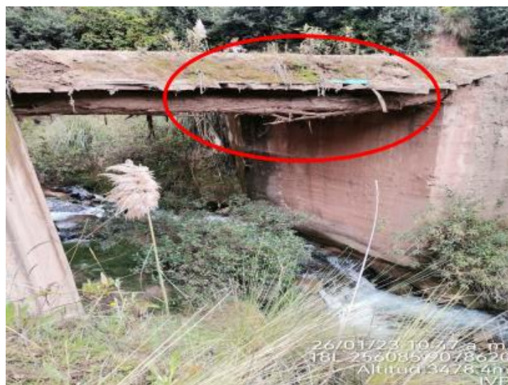
Figura 1. Vista Frontal

Se puede observar que el tablero de rodadura es de tabloncillos de madera y se soporta en Troncos desgastados por el tiempo. No cumple con los estándares del manual de puentes.