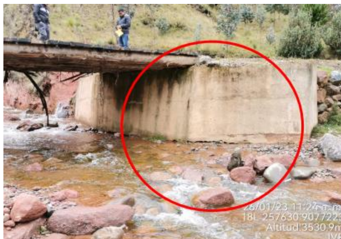
Figura 2. Vista Estribo Derecho

Se observa que el estribo derecho se encuentra construido de concreto armado. No existe pilares. A su vez, se puede observar fracturas, presenta socavación por contracción o acorazamiento de su cauce. No cumple con los estándares del manual de puentes.