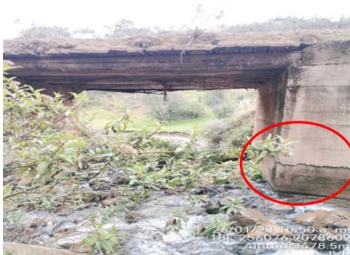
Figura 2. Estribo Derecho

Se observa que el estribo del margen derecho se encuentra fracturada. No cumple con los estándares del manual de puentes.