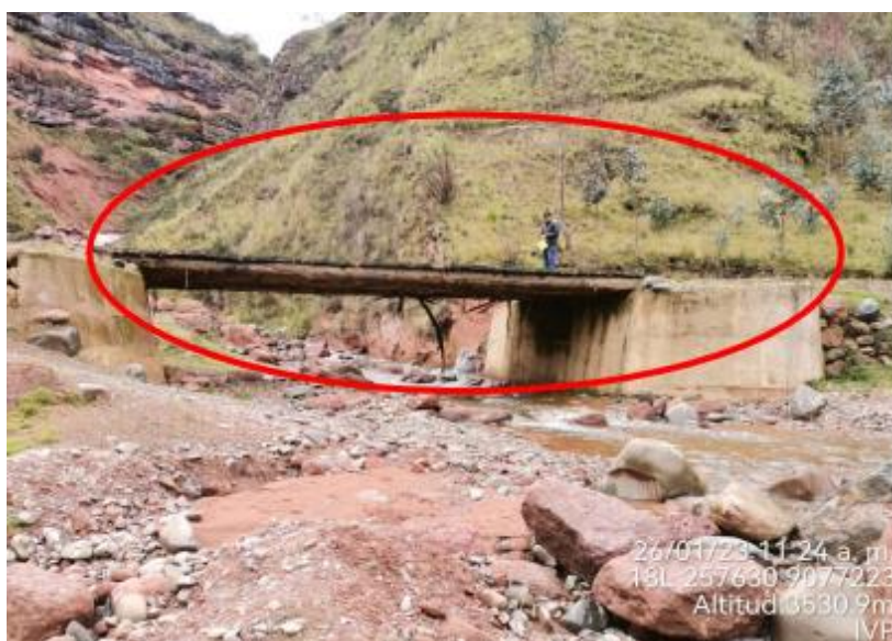
Figura 1. Vista Frontal

Se puede observar que el tablero de rodadura es de tablones de madera y se soporta en Troncos. No cumple con los estándares del manual de puentes.