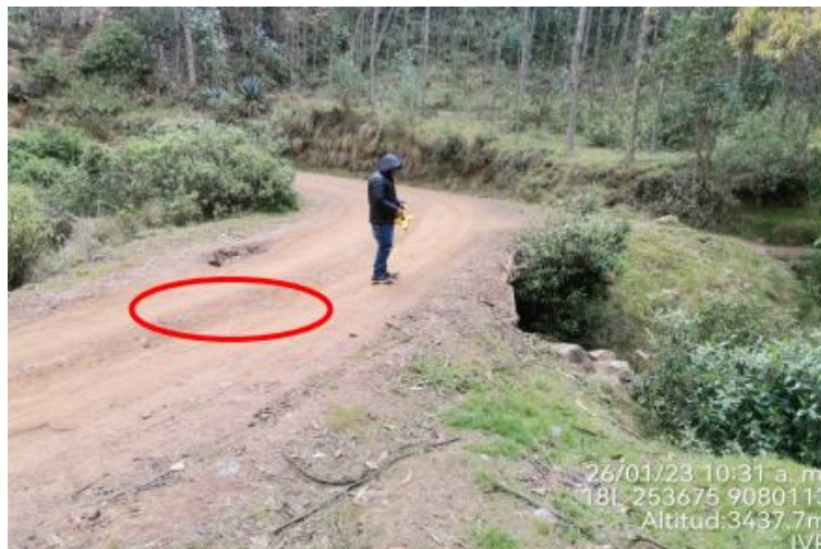
Figura 4. Vista Frontal

Se observa que el puente no cuenta con barandas de seguridad, lo que es un riesgo latente. El puente no cuenta con accesos ni lozas de aproximación, no cumple con los estándares del manual de puentes.