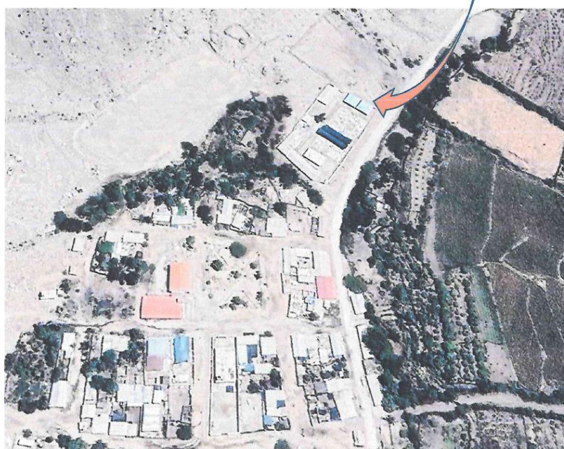
Imagen 01: Muestra la Localización de la localidad de Palca