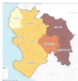
LOCALIDAD CAFETAL OLLEROS