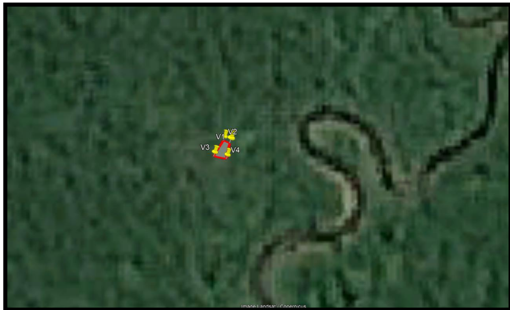
GRÁFICO N° 04: UBICACIÓN GEOGRAFICA SATELITAL DEL PROYECTO