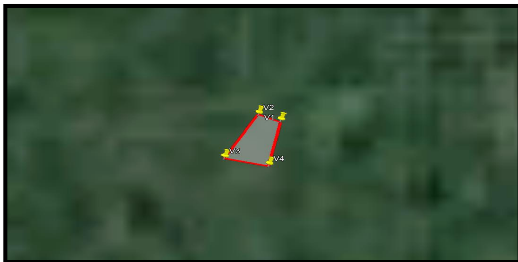
GRÁFICO N° 05: UBICACIÓN GEOGRAFICA SATELITAL DEL PROYECTO