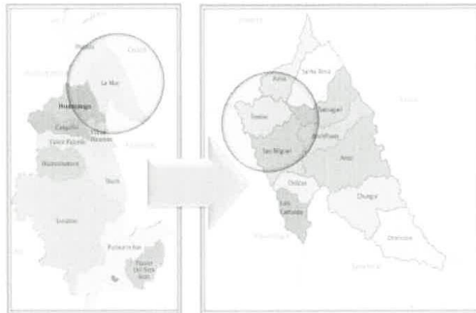
FIGURA N° 02 - MAPA DE UBICACIÓN REGIONAL Y PROVINCIAL