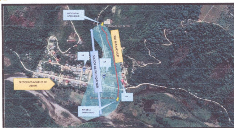
CROQUIS DEL TRAMO A INTERVENIR