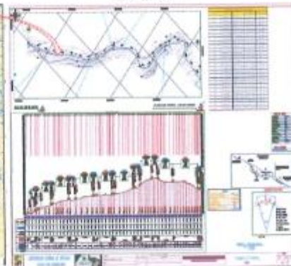
Ilustración N° 03: Mapa de la zona de intervención