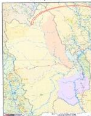
Ilustración N° 02: Mapa de la provincia de Moyobamba