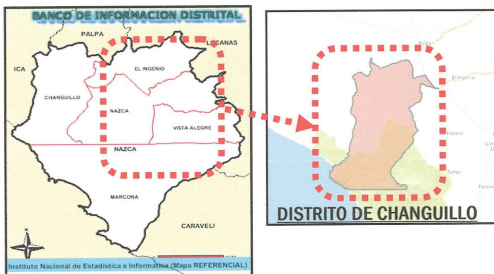
IMAGEN N° 02 PLANO DE UBICACIÓN DE LA LOCALIDAD DE SANTA ROSA DEL SECTOR COYUNGO