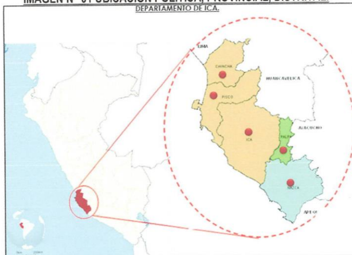
IMAGEN N° 01 UBICACIÓN POLITICA, PROVINCIAL, DISTRITAL.

Departamento : Ica. Provincia : Nasca. Distrito : Changuillo. Localidad : Santa Rosa del Sector Coyungo