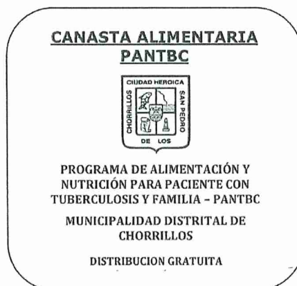
Imagen 2: Modelo de Rotulo del Reempaque de la Canasta Alimentaria PANTBC

En la entrega de las canastas, se exigirá que las mismas presenten sus rotulados conforme a los rotulados de la Imagen N° 02.