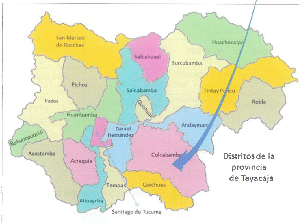
Localización de la Provincia al Distrito