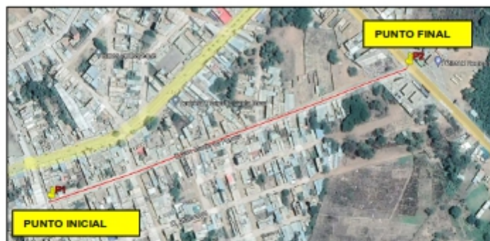
Ilustración N° 01: Localización del Proyecto

MUNICIPALIDAD DISTRITAL DE OLMOS "Decenio de la igualdad de oportunidad para mujeres y hombres" "Año de la unidad, la paz y el desarrollo"