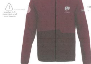
Casaca ligera pensada para el uso día