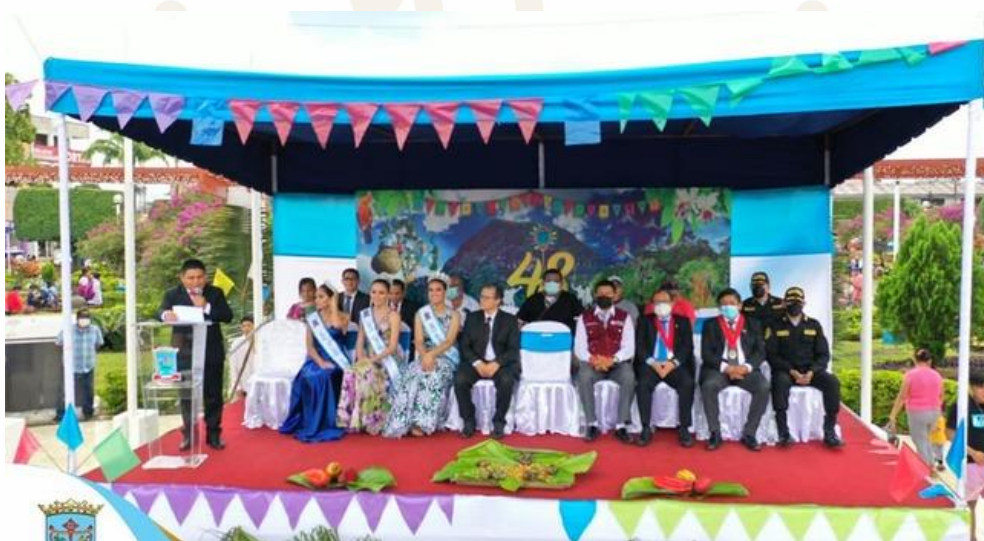
La Comisión Central de la 50° Semana Turística de Moyobamba

Servicio de instalación y decoración de escenario en las aguas termales de San Mateo, para la recepción de las delegaciones de concursantes y participantes del baño bendito. Se adjunta imagen referencial: