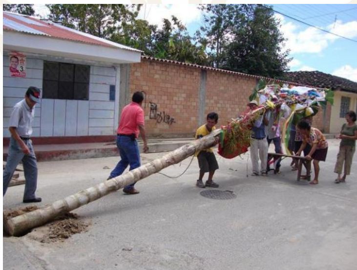
La Comisión Central de la 50° Semana Turística de Moyobamba