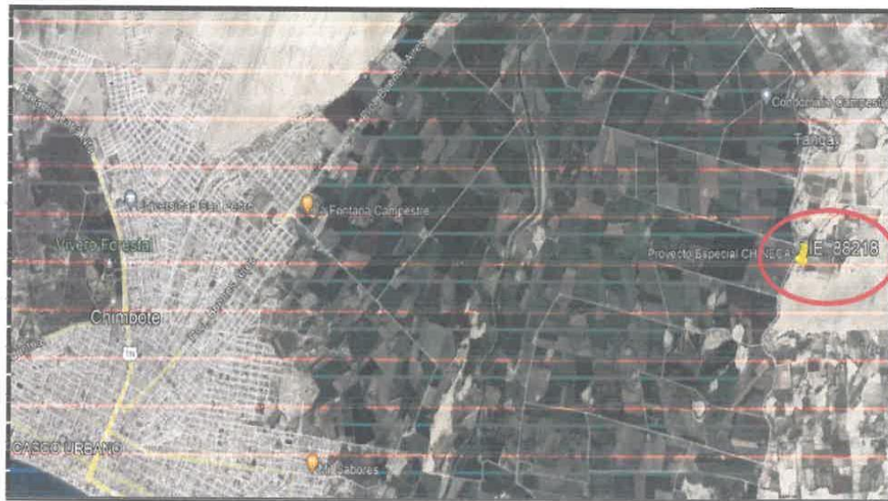
Imagen 01 – Vista Satelital de la I F 88218

Vista satelital de la localización del proyecto, en la imagen se muestra la IE 88218 EN EL C.P. TANGAY MEDIO, DISTRITO DE NUEVO CHIMBOTE, PROVINCIA DEL SANTA, DEPARTAMENTO DE ANCASH", la cual tiene las coordenadas UTM mencionadas en el cuadro superior.