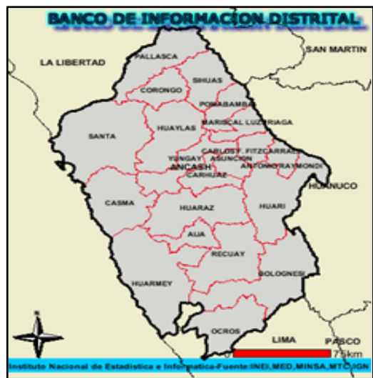
Departamento de Ancash