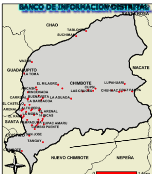
Provincia de Santa