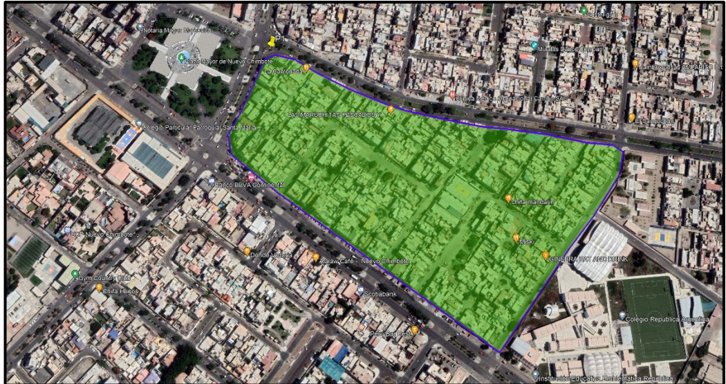
Micro Localización (Distrito Nuevo Chimbote – URB. EL PACIFICO)