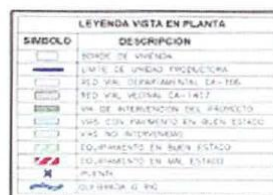
Ilustración 4. Plano de cierre de brechas del proyecto.

La Municipalidad Distrital de Asunción, en su objetivo principal de brindar óptimas condiciones de los servicios de espacios públicos, así como adecuadas condiciones habitabilidad y circulación peatonal de los pobladores que moran en las distintas zonas de la Ciudad Asunción, ha realizado los estudios proyecto integral denominado "MEJORAMIENTO DE LOS SERVICIOS DE ESPACIOS PÚBLICOS URBANOS EN "PARQUE BATAMPAMPA" DE CENTRO POBLADO ASUNCIÓN, DISTRITO DE ASUNCIÓN, DE LA PROVINCIA DE CAJAMARCA, DEL DEPARTAMENTO DE CAJAMARCA" , con código único de inversión CUI 2631626 . Con la finalidad de mejorar la calidad de vida de los pobladores beneficiarios.