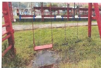
Ilustración 9. JUEGOS INFANTILES Deterioro de equipamiento y zona de juego.

La infraestructura actual cuenta con juegos para infantes de madera, plástico y metal. Los juegos se encuentran directamente apoyados al terreno por medio de dados de concreto simple. Debido a que las áreas verdes donde se encuentran apoyados, no cuentan con pendiente para drenaje, las uniones de los dados y de los elementos de madera o metal se encuentran muy deterioradas, debido a un contacto permanente con el agua, siendo actualmente peligro frente a su uso. Así mismo, los elementos de madera y metal que constituyen los juegos presentan deformaciones y alto de deterioro, ya que sus dimensiones y las capas de protección frente al intemperie no son las adecuadas.