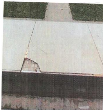
Ilustración 8. BANCAS DE CONCRETO CON ACABADO CERAMICO Daños de acabados de bancas de concreto.

La infraestructura actual cuenta con juegos para infantes de madera, plástico y metal. Los juegos se encuentran directamente apoyados al terreno por medio de dados de concreto simple. Debido a que las áreas verdes donde se encuentran apoyados, no cuentan con pendiente para drenaje, las uniones de los dados y de los elementos de madera o metal se encuentran muy deterioradas, debido a un contacto permanente con el agua, siendo actualmente peligro frente a su uso. Así mismo, los elementos de madera y metal que constituyen los juegos presentan deformaciones y alto de deterioro, ya que sus dimensiones y las capas de protección frente al intemperie no son las adecuadas.