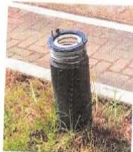
Ilustración 12. LUMINARIA DE PISO Luminaria de piso deteriorada e inoperativo.

Un porcentaje grande de los puntos no funciona, debido a daños en la canalización, deterioro de la luminaria y falta de lámpara. En el caso de puntos de iluminación para circulación y descanso, están ubicados en puntos pocos estratégicos y aparentemente no el número no es el suficiente. En el caso de puntos de iluminación para actividades deportivas, el número y capacidad de las luminarias y lámparas no son los suficientes para brindar la capacidad luminica establecida en la normativa.