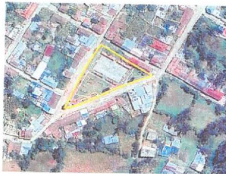
Ilustración 1. Ubicación del proyecto