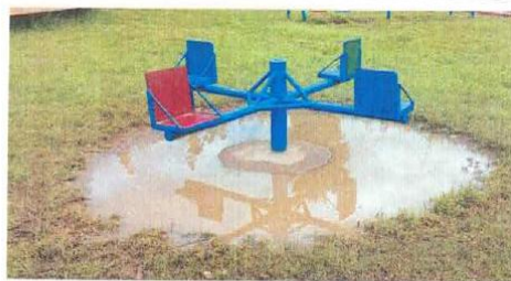
Ilustración 10. JUEGOS INFANTILES Deterioro de equipamiento y zona de juego.