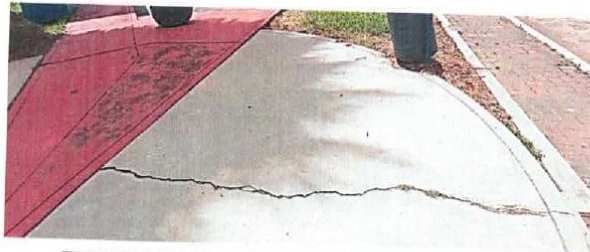
Ilustración 4. CIRCULACIÓN DENTRO DE PARQUE Vista de rajaduras y fisuras de veredas interiores.