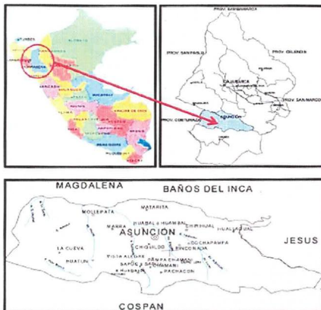
Ilustración 2. Imagen satelital ubicación de la ciudad de Asunción.