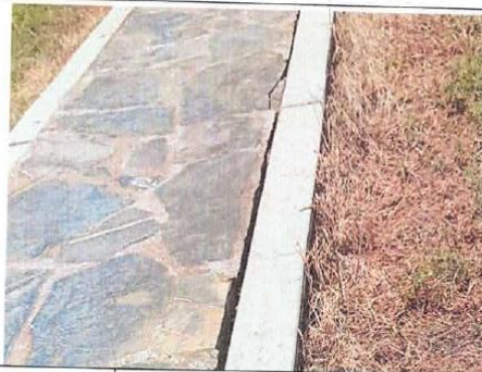
Ilustración 5. CIRCULACIÓN DENTRO DE PARQUE Vista de rajaduras y fisuras de piso de concreto y piedra.