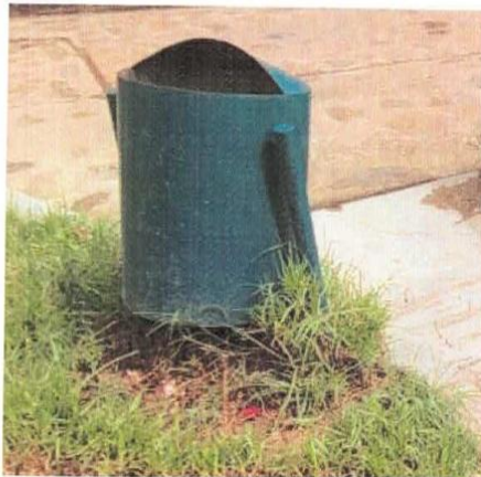
Ilustración 11. TACHO DE BASURA Tacho de basura oxidada e inoperativo.

Se cuenta con tachos para basura con plancha y tubo de fierro negro pintadas, los cuales en la actualidad presentan alto porcentaje de oxido y daño en la pintura; además, de que se encuentran inoperativos debido al peso.