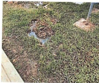
Ilustración 6. ÁREAS VERDES DE PARQUE Vista de pésimo estado de áreas verdes.

Las áreas verdes se encuentran en mal estado de conservación debido, a la falta de pendiente y puntos de descarga para drenaje, lo que contribuye a la generación charcos y lodo. Así mismo carece de árboles y arbustos ornamentales y decorativos que brinden un mejor aspecto paisajista.