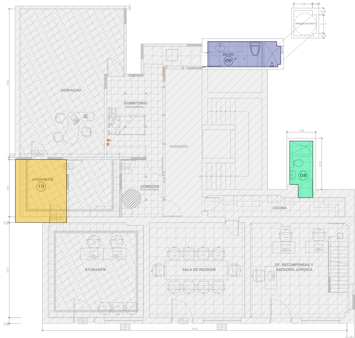
PLANO - TRABAJOS PRELIMINARES 3ER PISO 1/100