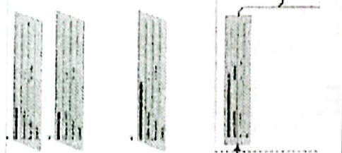
FUENTE: FOLIO 140 DE LA PROPUESTA DEL POSTOR; CONSORCIO PILLCO MARCA

Tal como se puede observar, el documento presentado es no claro - ilegible. En ese sentido, el comité de selección determina como no valida la acreditación de METODOLOGIA DE PROPUESTA por ser incongruente.