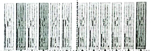
FUENTE: FOLIO 142 DE LA PROPUESTA DEL POSTOR; CONSORCIO PILLCO MARCA

De la revisión integral a los factores de evaluación el postor no acredita la totalidad de la información requerida para acreditar la METODOLOGIA DE PROPUESTA, por presentar documentos no claros - ilegibles, tal como se muestra en el siguiente cuadro: