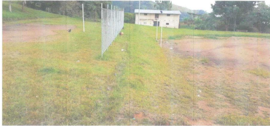
Fotografía N° 01. Vista del área destinada para el proyecto.

deporte en condiciones adecuadas, mejorando la imagen y calidad de vida de los pobladores.