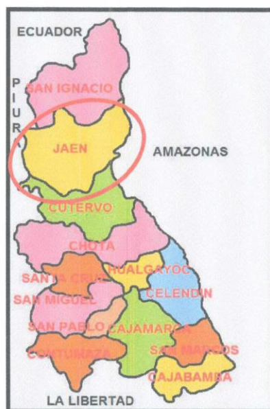
Gráfico N°02 - JAÉN