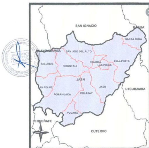
Gráfico N°03 – JAÉN