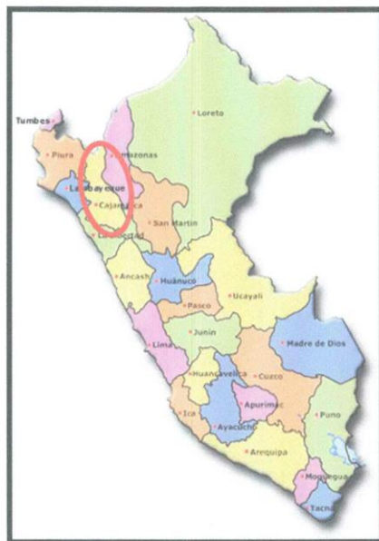
Gráfico N°01 – CAJAMARCA