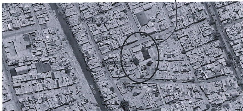
Ubicación de la I.E. N° 22542

La I.E. N° 22542 se encuentra ubicado en el Pueblo Joven Acomayo Zona “B” del distrito de Parcona, provincia de Ica, y ofrece a los habitantes de la zona el servicio de educación básica regular en el nivel de primaria, siendo polidocente completo. La institución educativa tiene como código modular 0564351 y código de local 212549.