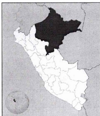
FIG. N°01: UBICACIÓN DE LA REGION LORETO