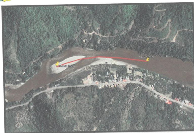
CROQUIS DEL TRAMO A INTERVENIR