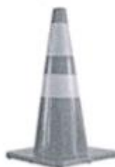
CONO DE SEGURIDAD