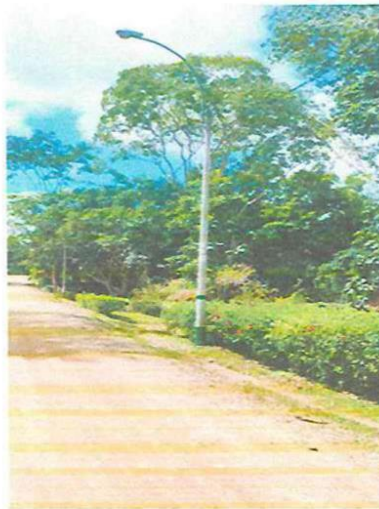
Poste de alumbrado Publico